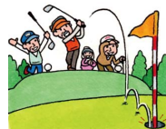
ホールインワン・アルバトロス費用